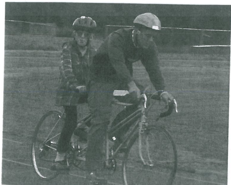
Een goede mogelijkheid om met een blinde te sporten

Een toenemende beperking van het gezichtsveld komt vaak voor bij ouderen. Ze kunnen of willen dat niet altijd zeggen. Bijvoorbeeld na een hersenbloeding of als ze dementerend zijn. Neem bij (zeer) oude cliënten daarom altijd het zekere voor het onzekere. Ga ook bij hen nooit naast ze staan of zitten.