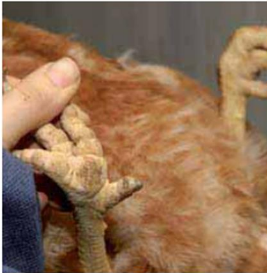
Zwellingen van of korstjes op de voetzolen zijn een teken van nat of scherp strooisel of scherpe uitsteeksels.