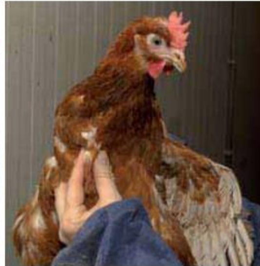
Een scherp uitstekend bot en te weinig bevezeling, wijst op een te lage voeropname.