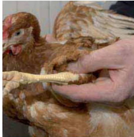
Stijve of warme gewrichten zijn vaak ontstoken.