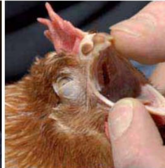
Hoor je afwijkende geluiden, kijk dan naar eventuele natte neuzen en in de keelholte of je slijm of andere tekenen van een ontsteking ziet.