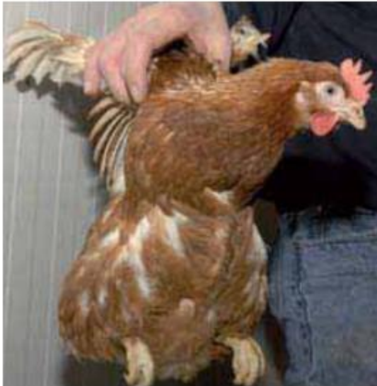
Bij het oppakken biedt een gezonde kip enige weerstand.