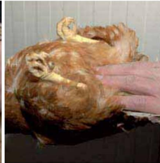
Is de ruimte tussen de legbotjes smaller dan twee vingers, dan legt de kip niet.